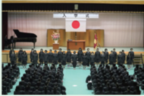
最後には音楽プランの生徒と合唱部による校歌の紹介がありました。混声の校歌なので、とても迫力があります。